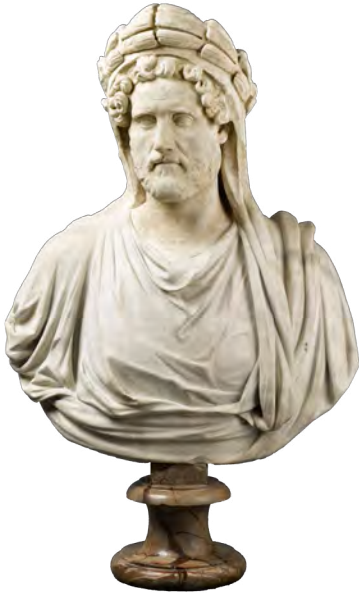
Buste d'Antonin le Pieux en frère Arvale, (prêtre de Dea Dia), voilé et couronné d'épis, Paris, musée du Louvre