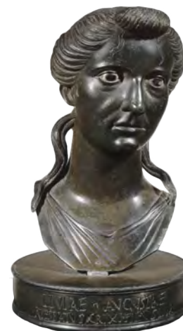
Portrait de Livie Paris, musée du Louvre