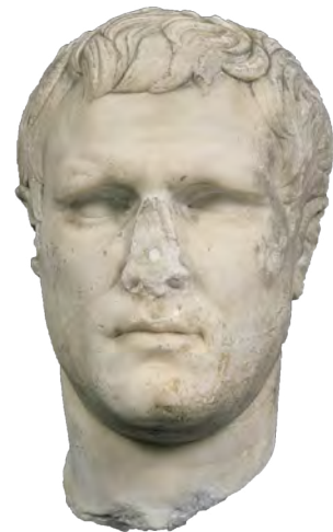
Portrait d'Agrippa, musée Saint-Raymond de Toulouse

Ce beau portrait d'Agrippa provient d'un important groupe statuaire dynastique situé sur le forum de Béziers. Agrippa, qui fut le plus proche conseiller et collaborateur d'Auguste devint son gendre suite à son remariage avec Julie, fille unique du Prince, en 21 av. J.-C. Ce brillant homme de guerre, membre éminent de l'entourage familial et politique d'Auguste, disparut brutalement en 12 av. J.-C. Le portrait de Béziers pourrait être immédiatement postérieur à sa disparition.