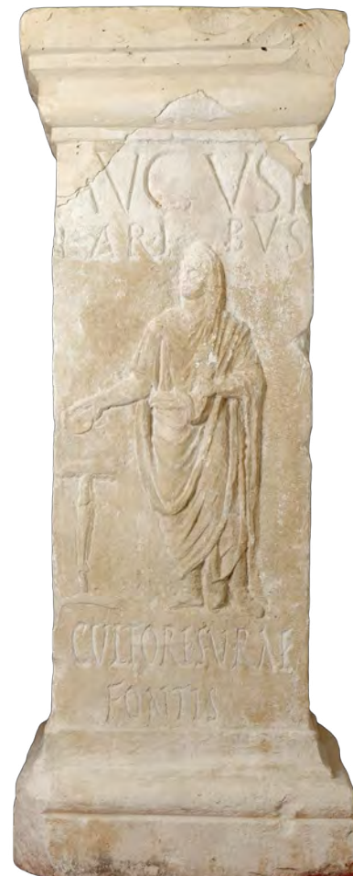
Autel aux Lares Augustes, 1 er s. ap. J.-C.

Du vivant de l'empereur, les hommages sont adressés aux différents aspects divinisés du pouvoir impérial ( Lares Augustes, Augustus, Numen , etc.). Le substantif Augustus , qui est le plus souvent employé, désigne implicitement la qualité divine contenue dans le surnom ( cognomen ) « Auguste ». D'abord étroitement associé à la personne du premier empereur, ce terme semble avoir acquis, par la suite, une valeur générique et renvoyer, de manière abstraite, à l'autorité impériale.