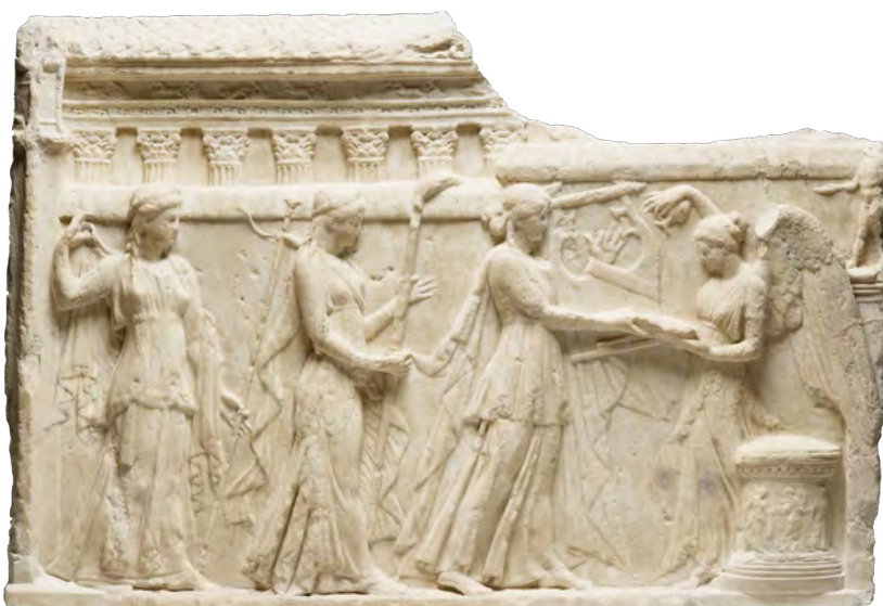
Relief, Paris, musée du Louvre

Sur ce portrait, Livie est figurée en Cérès, déesse associée à la paix et à la prospérité, dont elle porte la couronne d'épis de blé. Cette assimilation visuelle de l'impératrice à la déesse est fréquente notamment dans le monnayage.