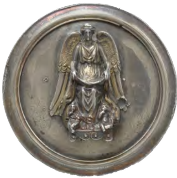
Médaille ornant le fond d'une coupe : Fortune ou Victoire, Paris, musée du Louvre

D'autres types iconographiques permettent de traduire le caractère surhumain de l'empereur et la préfiguration de sa divinisation en associant son portrait individualisé à une iconographie héroïque ou divine. Ainsi, les types « héroïsants » en nudité ou semi-nudité, imités des statues de héros et athlètes, et le type avec manteau autour des hanches inscrivent le personnage