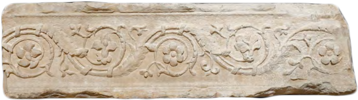
Frise d'acanthé couronnant le socle de l'autel de l'Augusteum du site de la Fontaine de Nîmes. Fin du I er s. av. J.-C. Calcaire

Il s'agit de l'un des sept blocs conservés de la frise qui couronnait le massif central du nymphée de l'Augusteum. Six blocs, restaurés pour l'occasion, sont présentés dans l'exposition.