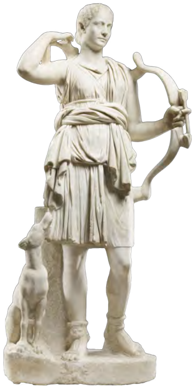
Statue de femme en Diane, Paris, musée du Louvre

Cette œuvre illustre la récupération dans la sphère privée de formules iconographiques divinissantes présentes dans l'art officiel. Ici, le portrait individualisé d'une femme est associé à un corps idéalisé revêtu de l'habit d'Artémis et portant ses attributs.