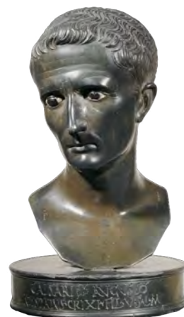
Portrait d'Auguste Paris, musée du Louvre

Aux côtés des divinités domestiques sont également vénérées des effigies sacrées (les imagines ) de l'empereur et de membres de sa famille, sous forme de statuettes en bronze, argent, pierres précieuses, verre... À travers elles est convoquée la puissance du Numen de l'empereur, gage de paix et de prospérité pour tous les habitants de l'Empire.