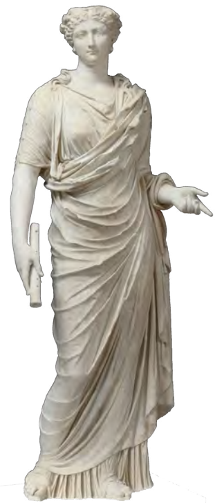
Statue de Livie en Cérès Paris, musée du Louvre

À partir de la fin des années 40 av. J.-C., Octavien se place sous la protection d'Apollon . En 28 av. J.-C., un temple est dédié au dieu sur le Palatin à proximité de sa demeure. Avec le retour de la paix et de la piété, qui succèdent aux désordres et à la violence de la dernière guerre civile, le Principat se présente comme l'émanation du règne d'Apollon et incarne un nouvel Âge d'or.