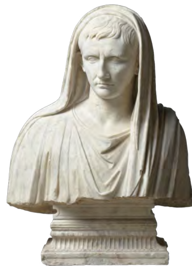
Fragment d'une statue : portrait d'Auguste en sacrifiant, Paris, musée du Louvre

Ces honneurs qui sont décernés à Auguste tout au long de sa longue carrière politique contribuent à construire une aura divine autour de sa personne, l'élevant au-dessus de ses concitoyens. Il fonde ainsi en partie son pouvoir sur la sacralisation de sa fonction.