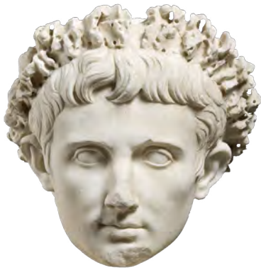
Portrait de l'empereur Auguste (27 av. J.-C.-14 ap. J.-C.) Paris, musée du Louvre

Cette tête, coupée en haut du cou, se rattache au type de Prima Porta sans doute créé en 27 av. J.-C. Les dimensions de ce visage, plus grande que nature, mais aussi l'idéalisation des proportions et l'atténuation de l'expressivité, confèrent à ce portrait posthume du Divin Auguste ( Divus Augustus ) une dimension hiératique et intemporelle. La couronne de feuilles de chêne peut renvoyer ici à la distinction octroyée à Auguste en 27 av. J.-C. (couronne civique). Cet attribut est aussi un symbole jovien (de Jupiter) qui permet d'évoquer la souveraineté d'Auguste sur le monde.